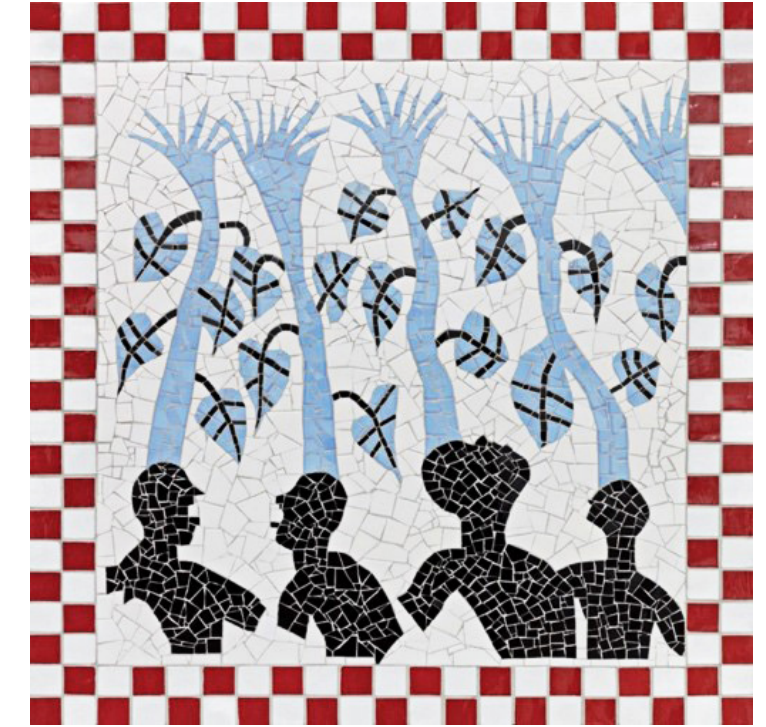
Song of flowers, Zellige 2024 Zellige | Zellig 80 x 80 cm Courtoisie : Bandjoun Station et Galerie 38

الزليج يذكرنا بالفسيخاء التي استخدمها بارتيليمي طوغو في تزيين مبنى باندجون ستيشن نفسه وواجهات المنازل والإقامات الموجودة في الحقول الزراعية التابعة له. لقد تم لقاء سعيد هنا : مفتونًا بهذه الحرف التقليدية، عمل الفنان مع حرفيين لنقل صور بعض أعماله إلى الزليج. إن الانتقال من مادة إلى أخرى باستخدام تقنية حرفية نبيلة، يتيح للفنان رؤية أعماله بمنظور جديد. كما يسمح للزوار بإعادة اكتشاف الإمكانيات اللامتناهية لفن تقليدي تم تجديده.