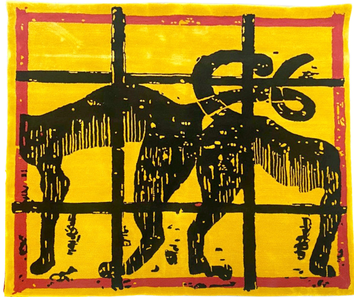
Alive in a box (série) 2024 Tapisserie en sabra (soie végétale) | Sabra Tapestry (vegan silk) 200 x 200 cm

أيقونات مجموعة الزرابي تأتي من سلسلة «أحياء في صندوق»، وهي نقوش نفذها الفنان خلال جائحة كوفيد-19. يعرض فيها عدوانية موقف أبقانا حبيسي منازلنا إن لم يقتلنا. السجن مشار إليه بشباك يشكل سياجًا يشبه القضبان، وبصرخة إنسان، وحيوانات بلا رؤوس، وبأشخاص محاصرين في وعاء. فضوله لرؤية نقوشه متحولة إلى نسيج، دفعه إلى التعاون مع حرفيين مغاربة واختار نوعية النسيج، فأعطى تكبير الصور نتيجة مذهلة. نسيج الصابرا التقليدي (الحرير النباتي) الذي يوفر شعورًا بصريًا ولمسًا مختلفًا، يستحضر عالم النحت. ويتجدد النسيج المغربي بواسطة عملية إعادة صياغة، عن طريق تصوير عالم قلق يستخدم الإنغلاق بل والسجن كمجاز.